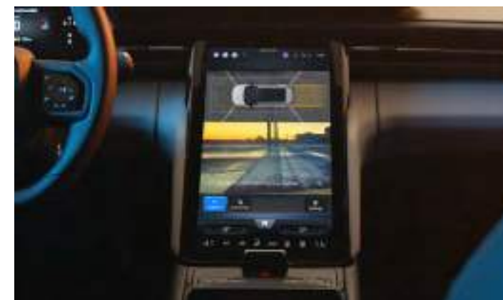
ACTIVE PARK ASSIST - SYSTEM WSPOMAGAJĄCY PARKOWANIE

Opcja dostępna tylko w pakiecie Driver Assistance