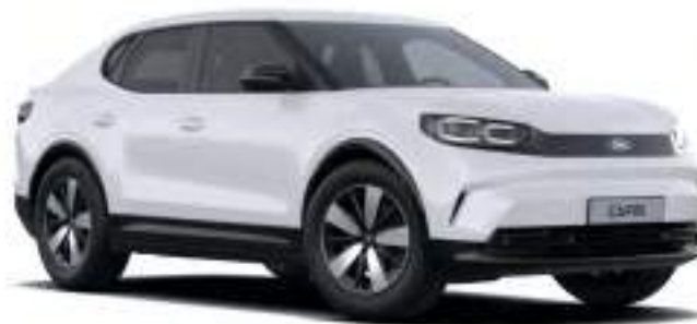
FROZEN WHITE - LAKIER ZWYKŁY 1 500 zł