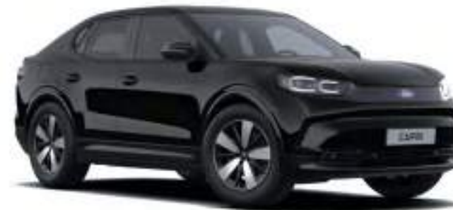
AGATE BLACK - LAKIER METALIZOWANY 3 000 zł