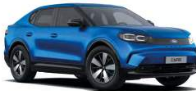
BLUE MY MIND - LAKIER METALIZOWANY SPECJALNY 4 500 zł