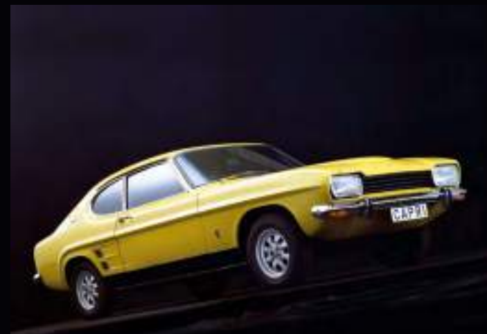
Ford Capri I generacji był produkowany w latach 1968 - 1986

Kolor nadwozia: Po lewej stronie - Blue My Mind (opcja), po prawej stronie - Vivid Yellow (bez dopłaty)