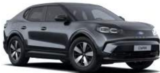
MAGNETIC GREY - LAKIER METALIZOWANY 3 000 zł