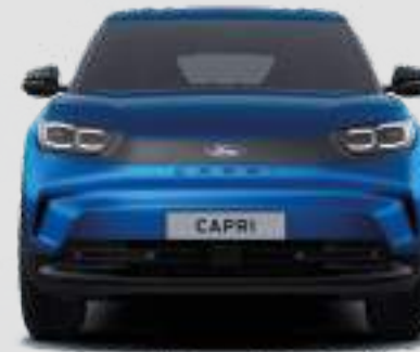
Szerokość całkowita z lusterkami: 2063 mm