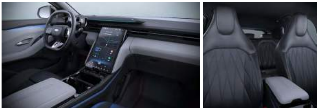
Nowy Ford Capri w wersji Premium z tapicerką skórzaną - skóra ekologiczna Sensico (standard)