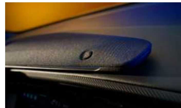
SYSTEM NAGŁOŚNIENIA PREMIUM B&O