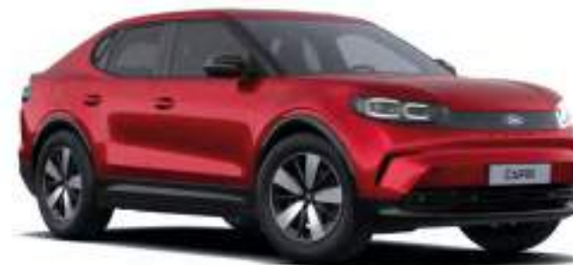
LUCID RED - LAKIER METALIZOWANY SPECJALNY 4 500 zł