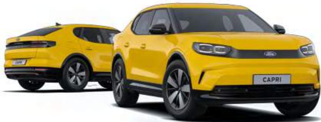
Nowy Ford Capri w wersji Capri z 19" obręczami ze stopów lekkich (standard dla wersji z bateriami o zwiększonej pojemności) oraz lakierem zwykłym Vivid Yellow (bez dopłaty)