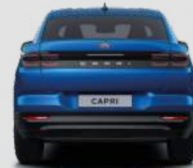
Szerokość całkowita ze złożonymi lusterkami: 1946 mm