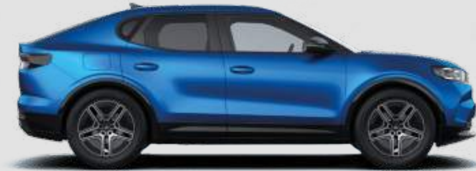
Długość całkowita: 4634 mm