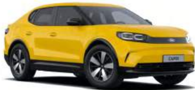
VIVID YELLOW - LAKIER ZWYKŁY bez dopłaty