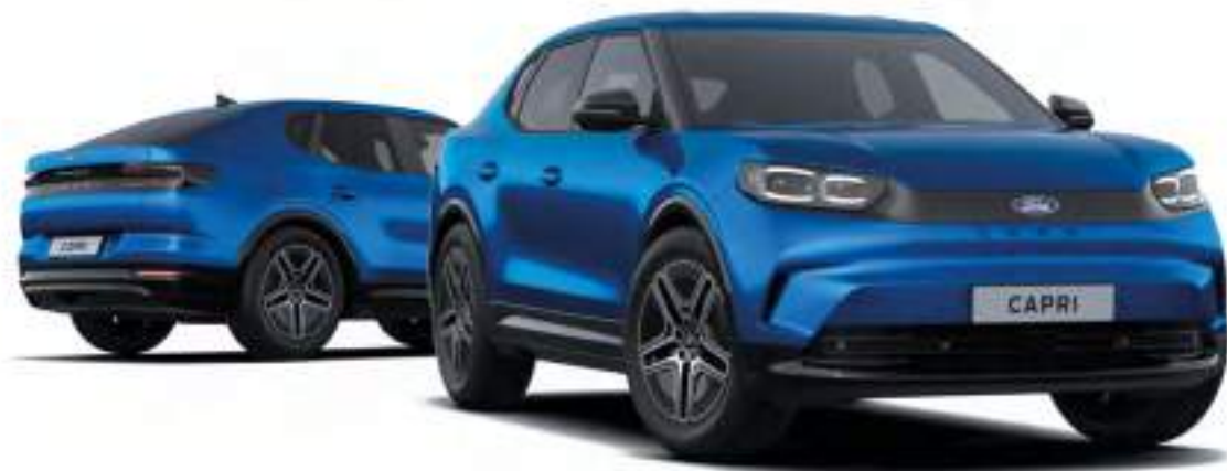
Nowy Ford Capri w wersji Premium z lakierem metalizowanym Blue My Mind (opcja)